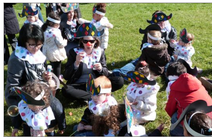
■ Les Arlequins de l'Île aux Enfants ont fait sensation.

Après avoir animé une ronde géante menée par un drôle de tigre, la fanfare « Les Tapageurs » a apporté une musique