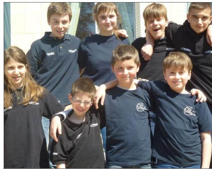
■ Les jeunes espoirs ont fini en roue libre et retrouvent le Top 16.

Un sans-faute tout au long de ces interclubs jeunes ! La dernière ronde contre Nancy Stanislas au château du Charmois comptait pour du beurre, le week-end dernier. Et les Vandopériens déjà assurés de finir champions de nationale 2 et de retrouver le Top 16 ont battu leurs voisins par 10 à 6.