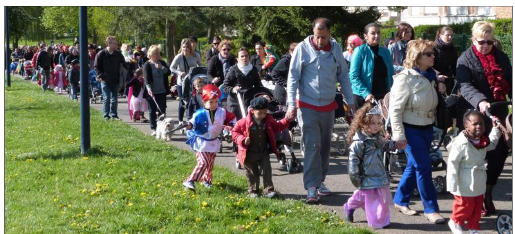
■ Un immense cortège emmené par la fanfare Les Tapageurs.

De nombreux parents s'étaient joints au joyeux défilé.