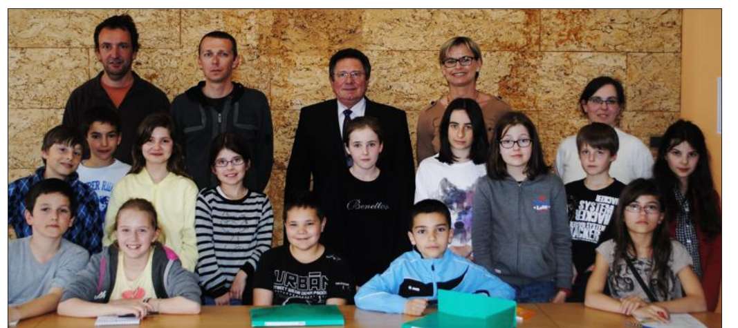
■ Les jeunes ont mis en pratique les bonnes attitudes pour économiser l'énergie.

Fort de ces découvertes, le conseil municipal des enfants poursuit ce travail en réfléchissant à une manière ludique de sensibiliser les jeunes de la commune aux économies d'énergie.