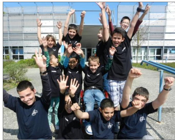
■ Les autres jeunes ont pu s'aguerir en nationale 4.

Ce dimanche encore, les douze autres enfants du club jouaient à Pont-à-Mousson pour finir la saison à la meilleure place possible. Ces jeunes moins aguerris répartis dans trois autres équipes (Vandœuvre 2, 3 et 4) étaient engagés pendant toute la saison en Nationale 4 avec, pour objectif, de s'aguerir à la compétition.