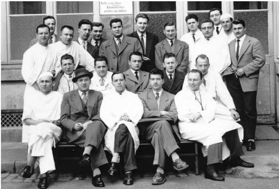
Internat 1956 (photo avec les noms en annexe)