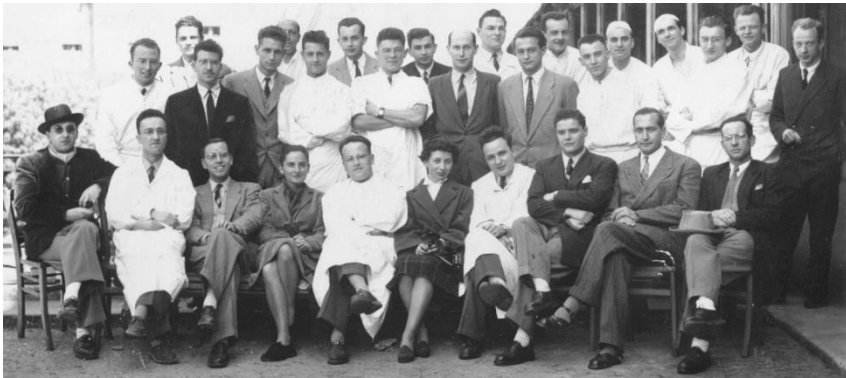
Internat 1953 (photo avec les noms en annexe)

Son cursus était depuis ses études secondaires marqué par l'élan donné à sa soif de connaissance, par une précocité hors du commun, une prodigieuse mémoire, une extraordinaire capacité de synthèse. Bachelier à quinze ans, major d'internat à vingt et un ans, Professeur agrégé à vingt-sept ans, Professeur titulaire de la chaire de Pathologie générale et de réanimation à trente-huit ans, il lui arriva de dire que dans les débuts de sa carrière, son principal handicap avait été sa jeunesse.