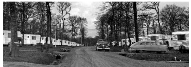
Trailer park de Toul-Rosières, 21 décembre 1955.

Dans cet ouvrage, les auteurs ont choisi de traiter trois aspects caractéristiques de cette époque qui n'ont, par ailleurs, jamais été envisagés sous cet angle : Toul et le Toulais, une garnison américaine de 1950 à 1967 ; l'organisation des services de santé américain et canadien en France, y compris les dépôts et les trains sanitaires ; l'US Army Aviation qui, parallèlement à l'US Air Force en Europe, entretenait sur notre territoire un réseau d'aérodromes et plus de trois cents avions légers et hélicoptères.